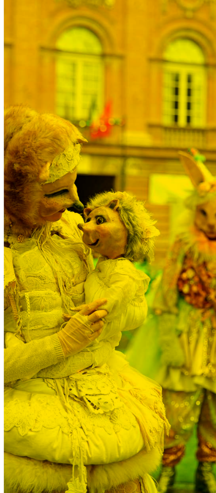
Les Irréels, Cie Créature