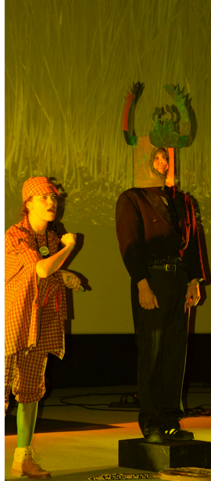
Cie Groenland Paradoxe